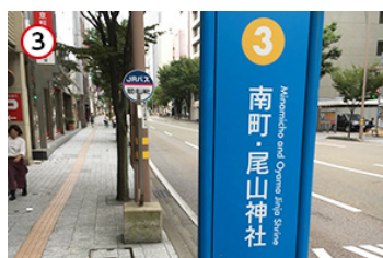
③ 「南町・尾山神社」のバス停で下車します。