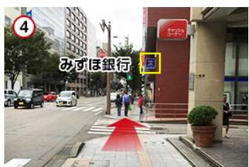
④ みずほ銀行方向へ直進し、横断歩道を渡ります。