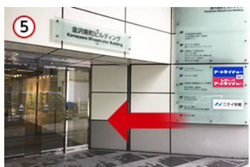
⑤ 「金沢南町ビルディング」の4階へお越しください。