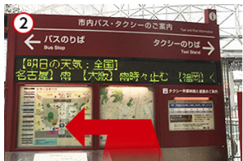
② 金沢フォーラス前のバス乗り場より「兼六園方面」行きのバスで「南町・尾山神社」まで乗ります。