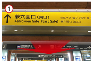
① 金沢駅の改札を出たら、兼六園口（東口）へ出ます。