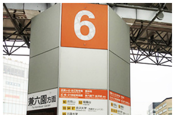
※金沢周遊バス（6番乗り場）のご利用が便利です。