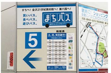
※まちバス（5番乗り場）からも「南町・尾山神社」までのバスが出ています。